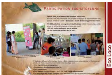
Rio Loco : bilan de la démarche éco-responsable