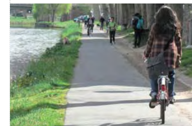
Canal du Midi: piste cyclable

○ Limitation des documents de communication et diffusion raisonnée, sensibilisation de tous les publics (internes et externes à la manifestation) à votre démarche éco-responsable.