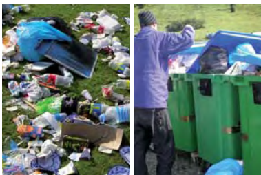
Tour de France (2001-2008) : baisse continue des impacts