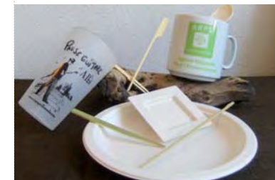
Vaisselle éco-conçue, vaisselle lavable et gobelet consigné