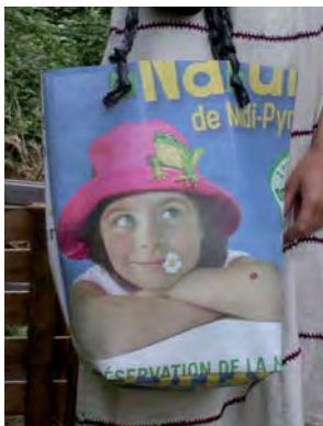
Sac fabriqué à partir de bâches signalétiques