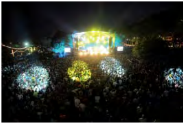
Festival Rio Loco