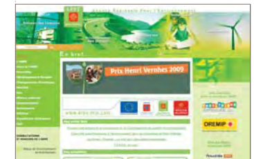
Page d'accueil www.arpe-mip.com