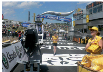
Tour de France