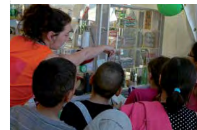
Festival Rio Loco: stand de sensibilisation