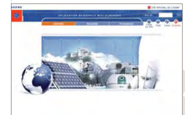
Page d'accueil www.ademe.fr/midi-pyrenees