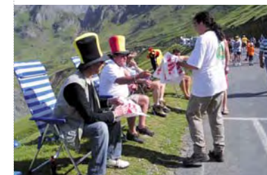
Tour de France en Midi-Pyrénées: distribution de sacs Vacances Propres au public