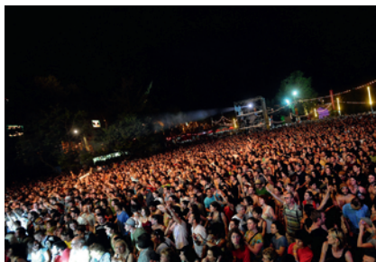
Festival Rio Loco

À titre d'exemples en 2008 en Midi-Pyrénées: le Festival Rio Loco a produit 6 fois moins de déchets que l'année précédente grâce à plusieurs actions (110 000 gobelets consignés et réutilisables, stand de sensibilisation, conteneurs facilitant le tri des déchets...). Les 5 toilettes sèches installées sur le Festival Pause Guitare ont permis d'économiser 12 000 litres d'eau. Sur le Festival Ecaussystème , un dispositif de 14 toilettes sèches a permis de récupérer 15 m 3 de copeaux souillés sur deux journées, lesquels ont ensuite été compostés pour faire de l'engrais. Enfin, 138 000 verres plastiques ont été économisés grâce à l'emploi de 85 000 gobelets réutilisables sur le Festival de Bandas y Peñas de Condom.