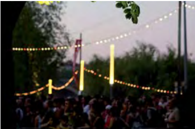
Rio Loco : éclairage basse consommation